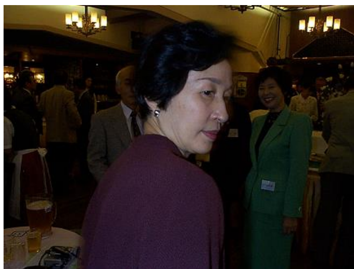
遠くから駆けつけてくれた北校の美人さんに焦点が・・・