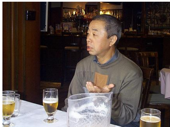
湯沢から参加して、楽しかったでしょうか…