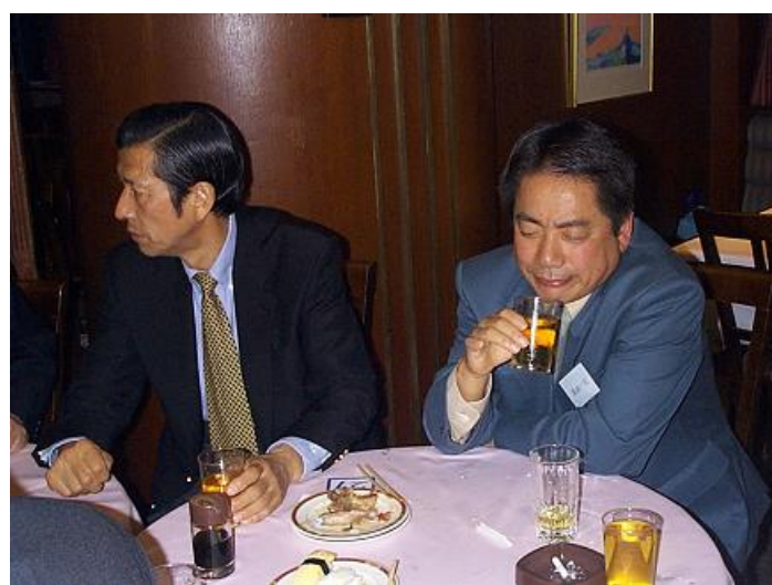
石垣さんは、どこをにらんでいるのでしょうか・・・ そして、相方もどこか思案顔ですねえ・・・・・・・・