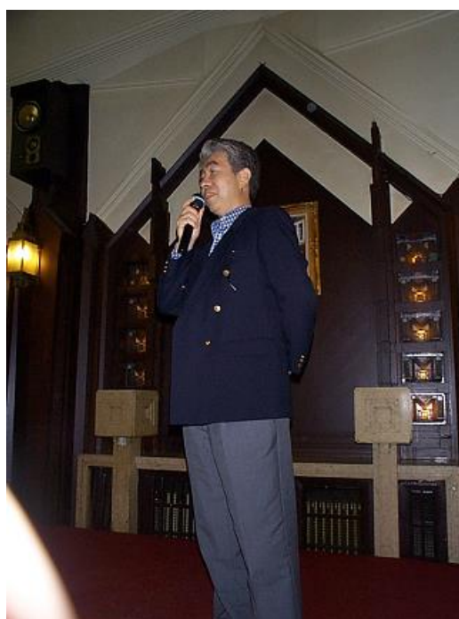
そして謙さんは、いつも格調の高い話を聞かせてくれる…