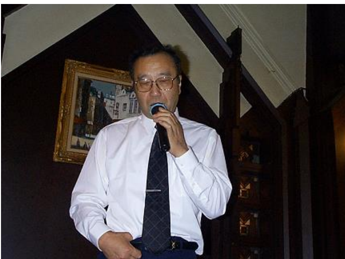
ベルトを握り締め、堂々と自慢の喉をご披露していたね・・・