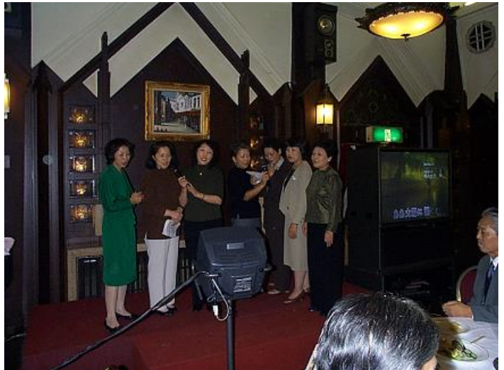
北高の美女連も少し増えてきて、調子が出てきたのかな・・・