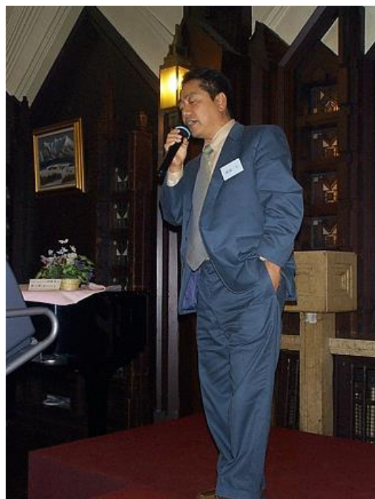
こちらもカラオケで歌に心酔している状態です・・・