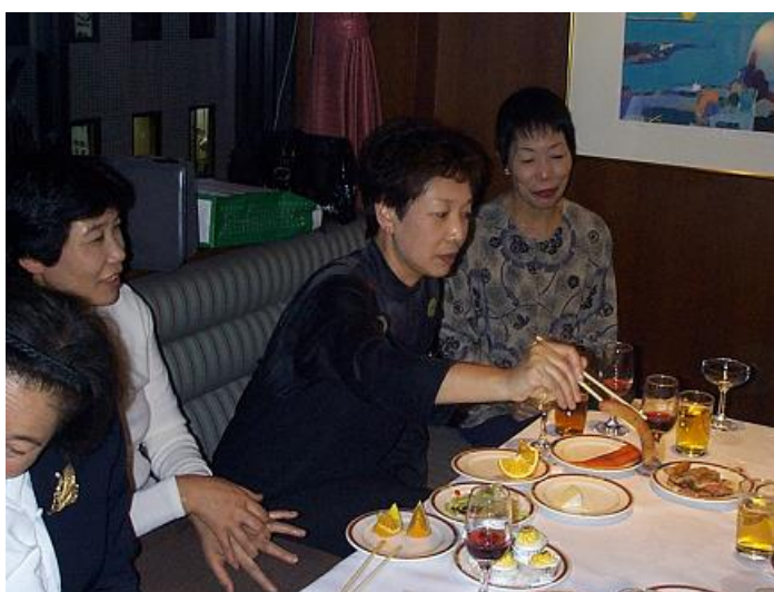
お料理をたべながら、楽しみに語り… 久しぶりの再会に高校生時代を懐かしんでいるのでしょうか…