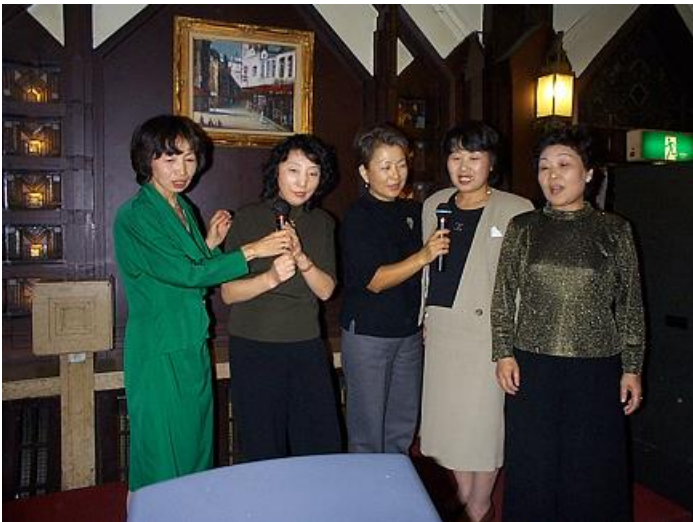
北高の美女たちのカラオケです・・・ どことなく遠慮勝ちなしぐさが、微笑ましいかぎり・・・