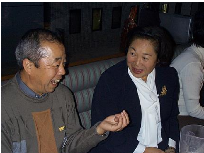
奈良さん、笑いながら何を数えているのでしょうか…