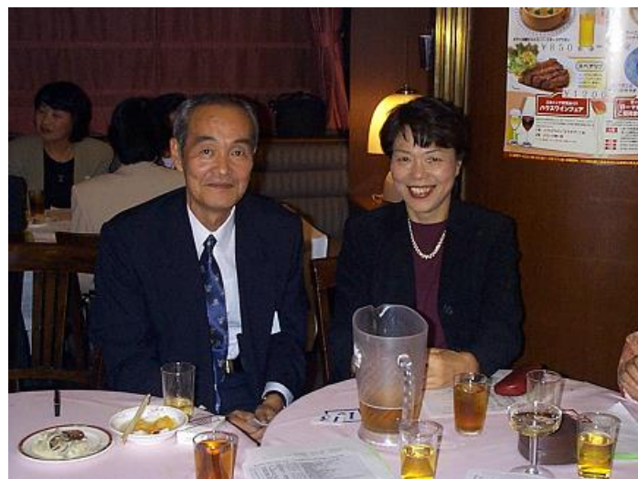
何とまあ楽しいなツーショットですねえ・・・