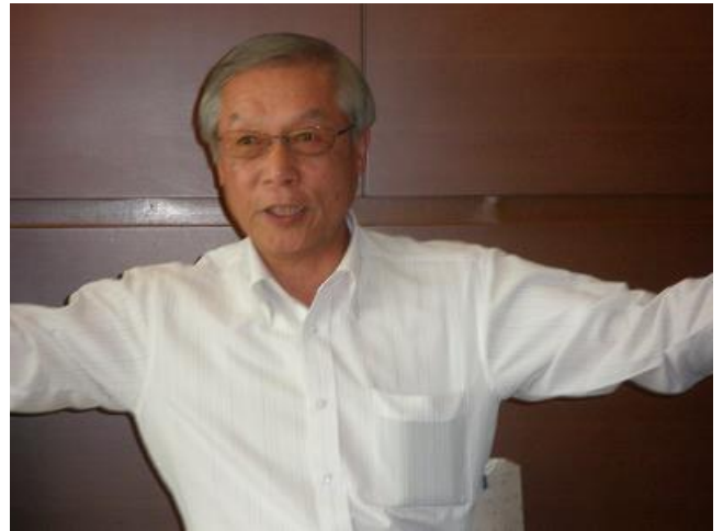
・いつでもカッコいい入江さん、今日もありがとう・・・ ・大きく手を広げ、何の説明なのか・・・目が輝いている・・・