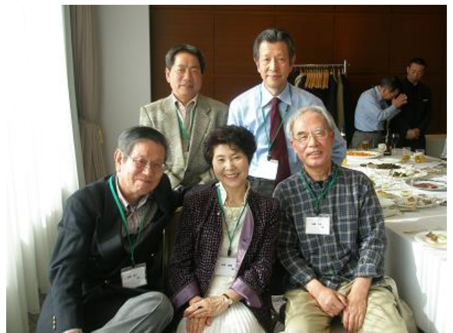
・今度はもう一人、葛城さんが・・・小さんも割り込んできた・・・