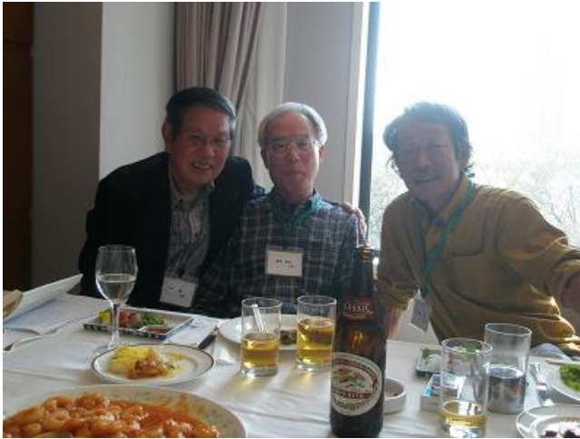
・三人とも大分召し上がった様子で、好い色艶ですね… 半世紀もの時が経ち、様々体験をしたでしょうし…そして、 この穏やかな表情…その昔ライバル同士だった面影の カメラも感じられない…