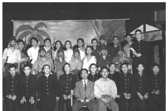
・「ビルマの竖琴」この中の何人かは今日も参加しているが・・・

徒然なるままに日暮PCに向かうことあたわず、夜な夜な写真を眺めキーボードをたたいている間に、春爛漫も一陣の風と共に過ぎ、葉桜が初夏に向かって繁茂しておりました。あの日の興奮と熱気も薄らいだかも知れないが、想いで的一端をお届けします。